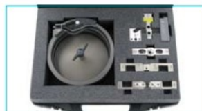
Erweiterungssatz / Add-on kit 6 mm 2