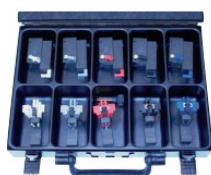
Wechselwerkzeuge 0,5 - 2,5 mm 2 Interchangeable Tools 0,5 - 2,5 mm 2