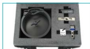
Erweiterungssatz / Add-on kit 2,5 mm 2