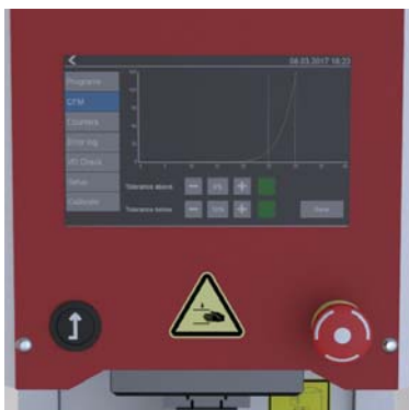
Integrierte Crimpkraftüberwachung Integrated Crimp Force Monitoring