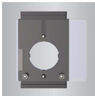
U-Die Adapter U-Die adapter