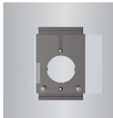
U-Die Adapter U-Die adapter