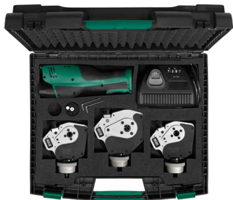
Bestückungsbeispiel Sample set

Please see our cable & connector tools catalogue for detailed information on locators or go to www.rennsteig.com