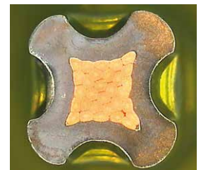
Querschnitt eines Vierdorncrimps Cross-section of a four-indent crimp

The case provides space for crimping units, but these must be ordered separately.